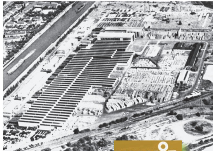
Hochansicht der Wanit Gesellschaft für Asbestzementerzeugnisse in der Schlossstraße 30, aufgenommen im Jahre 1971.

Drei bedeutende Unternehmen haben Mitte 1950 die Wanit Gesellschaft für Asbestzementerzeugnisse gegründet. Es waren: die Rhein Stahl Hüttenwerke, die Buderus'sche Eisenwerke und die Halberger Hütte. Die Produktionsaufnahme wurde auf einem 17 ha großen Gelände zwischen Kanal, Schloss- und Alleestraße im Jahre 1958 aufgenommen. Auf einer Platten- und einer Rohrstraße (später waren es je drei Fertigungsstraßen) wurden verschiedene Asbestprodukte als Brandschutz, Rohrisolierung, und Dachdeckung für den Hoch- und Tiefbau hergestellt. Anfang der 1980er Jahre waren in dem Betrieb an der Schlossstraße 30 bis zu 750 Mitarbeiter beschäftigt.