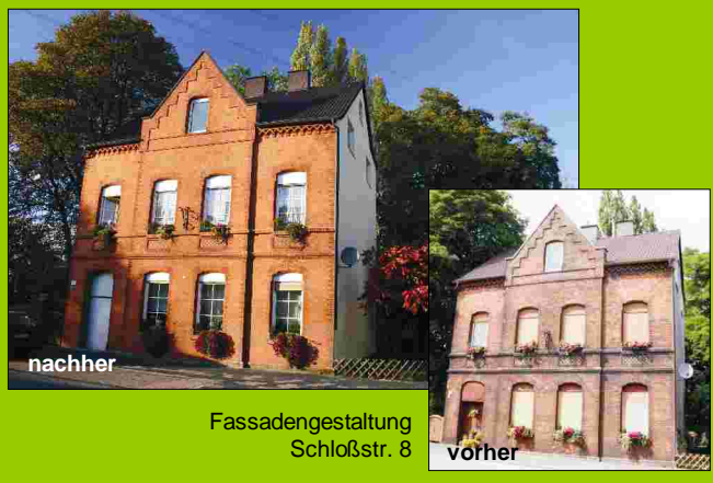
Fassadengestaltung Schloßstr. 8