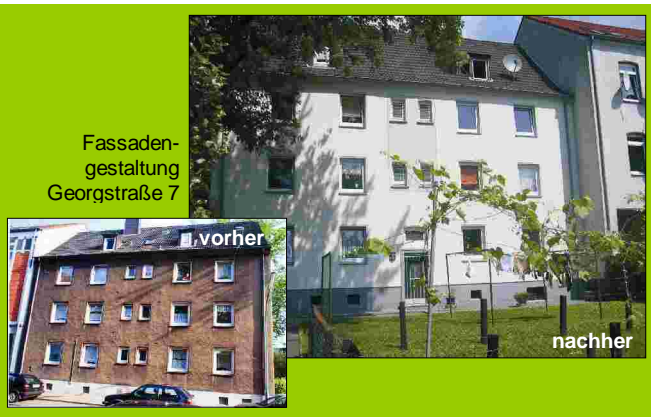
Fassaden- gestaltung Georgstraße 7