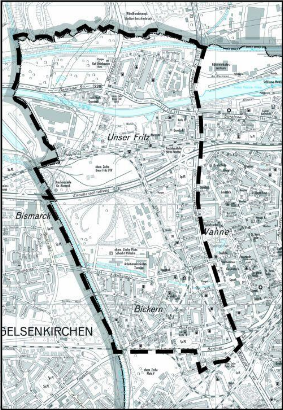
Maßstab ca. 1:20.000 (1cm auf der Karte = 250m in der Natur)